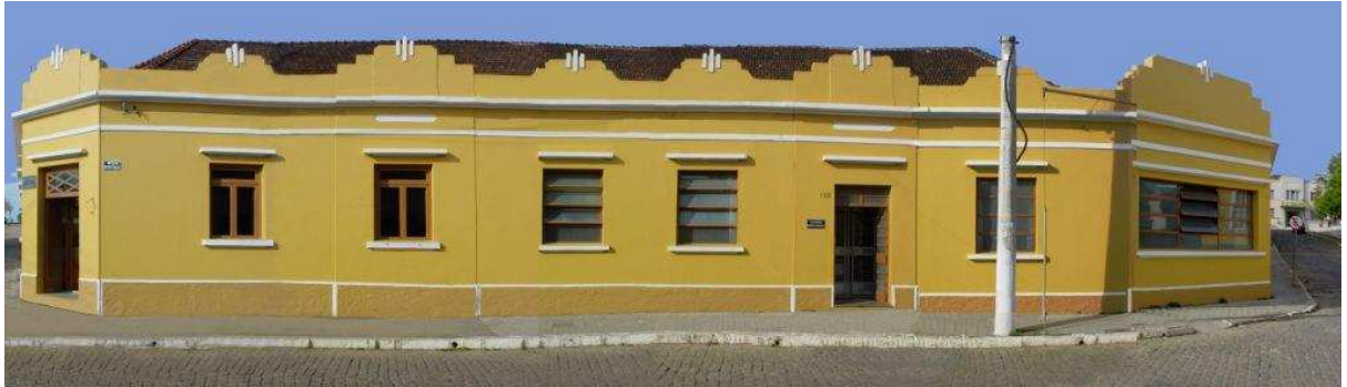
RUA BENTO G_Q02