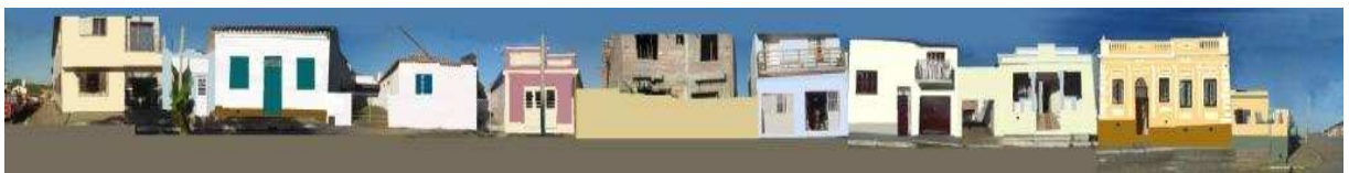
RUA MAURICIO CARDOSO_Q20