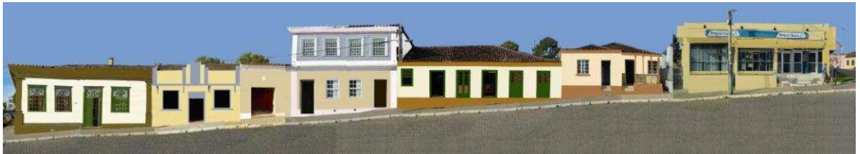
RUA BENTO G_Q05