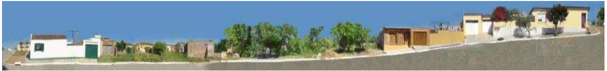
RUA 20 DE SETEMBRO_Q07