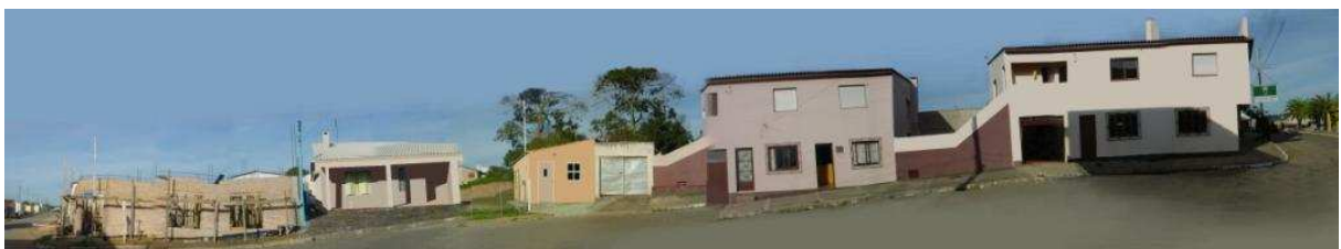
RUA CRISPIM GOMES_Q20