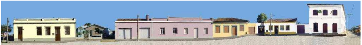
RUA CORONEL MANOEL PEDROSO_Q10