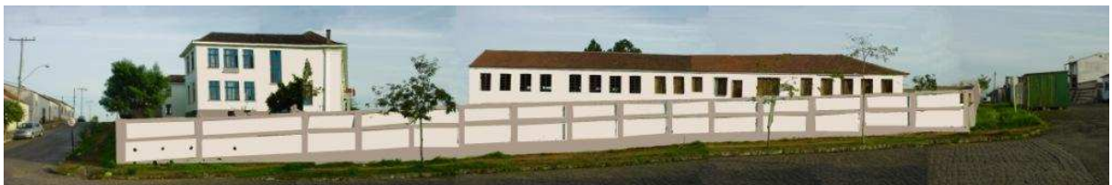
RUA SETE DE SETEMBRO_Q18