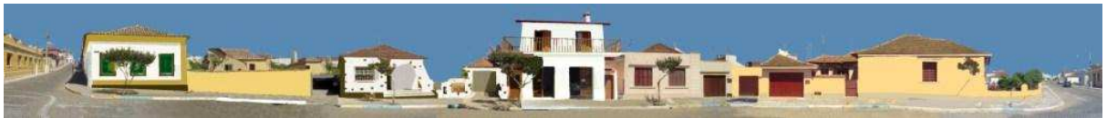
RUA COMENDADOR FREITAS_Q08