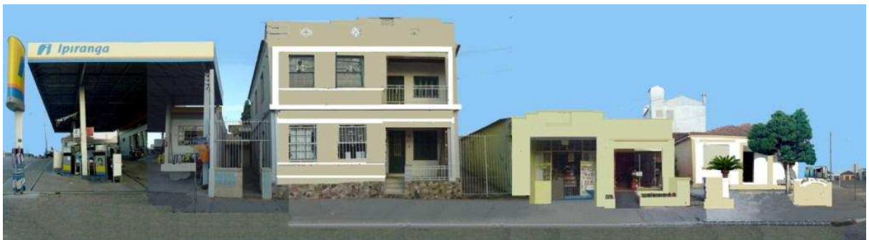
AVENIDA MAURICIO CARDOSO_Q19