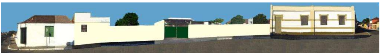
RUA CORONEL MANOEL PEDROSO_Q09