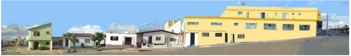
RUA OSWALDO ARANHA Q_21