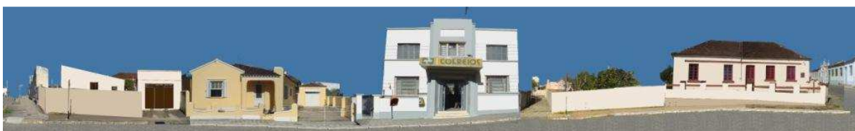
RUA XV DE NOVEMBRO_Q03