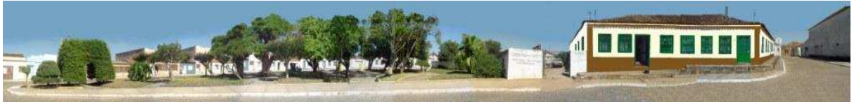
RUA COMENDADOR FREITAS_Q04