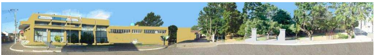
RUA CORONEL MANOEL PEDROSO_Q05