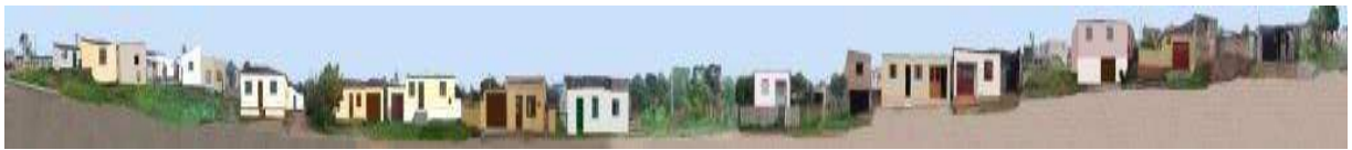
RUA 20 DE SETEMBRO_Q116