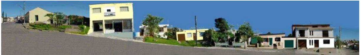
RUA GEN CANABARRO_Q16