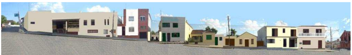
RUA OSWALDO ARANHA_Q17