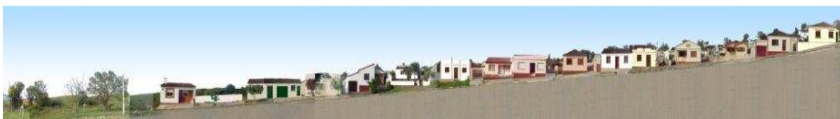
RUA XV DE NOVEMBRO_Q01