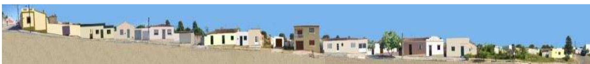
RUA 15 DE NOVEMBRO_Q14