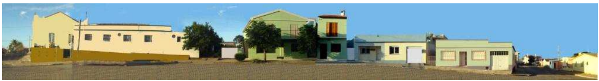
RUA OSWALDO ARANHA_Q20