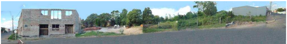
RUA GENERAL CANABARRO_Q17