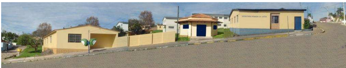
RUA XV DE NOVEMBRO_Q117