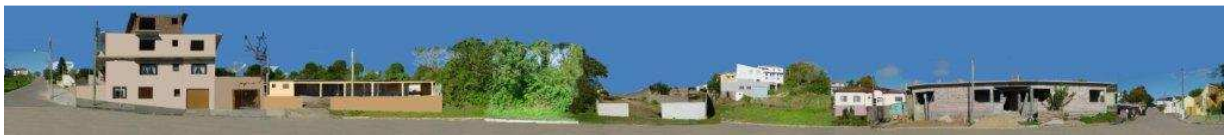
RUA EDMUNDO XAVIER_Q16