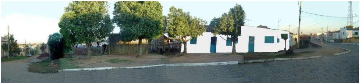
RUA GENERAL NETO_Q116