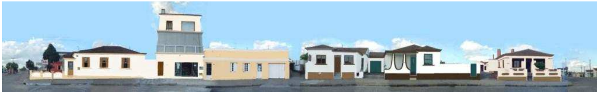
RUA JOÃO DE DEUS VALENTE_Q19