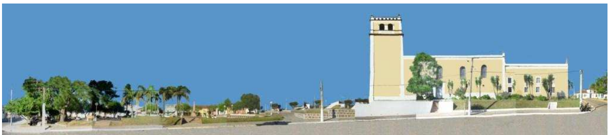
RUA COMENDADOR FREITAS_Q01