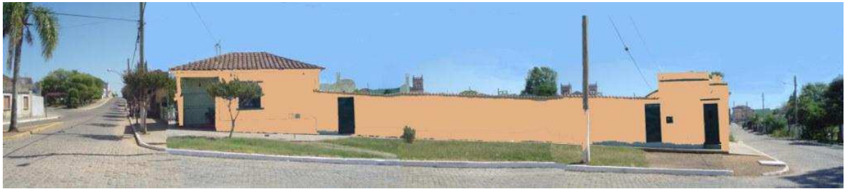
RUA GENERAL NETO_Q07