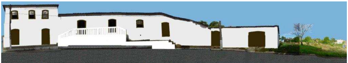
RUA 24 DE MAIO_Q13