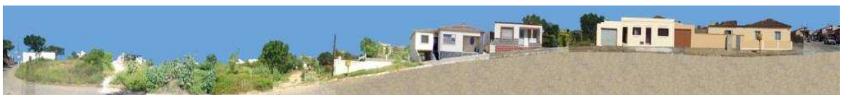
RUA GENERAL DALTRO FILHO_Q13