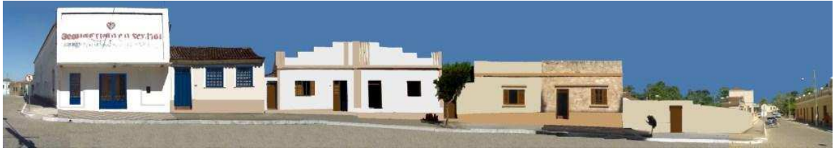
RUA COMENDADOR FREITAS_Q03