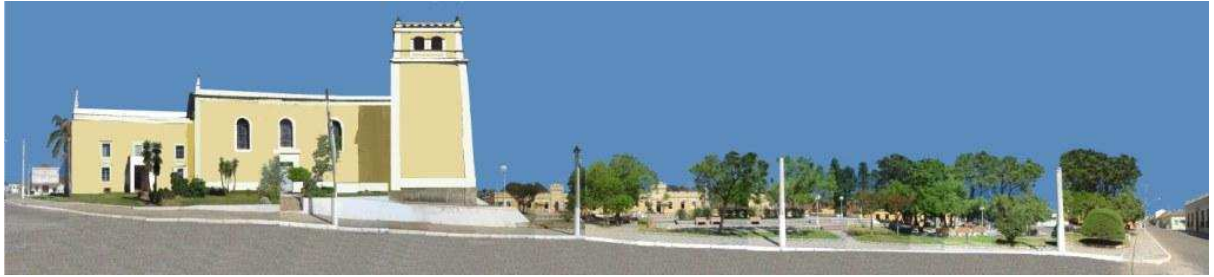
RUA 20 DE SETEMBRO_Q01