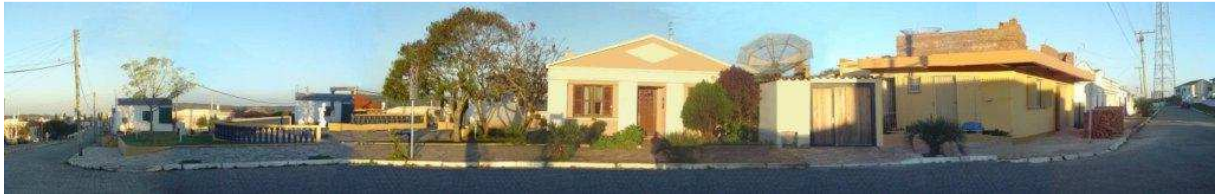
RUA GENERAL NETO_Q115