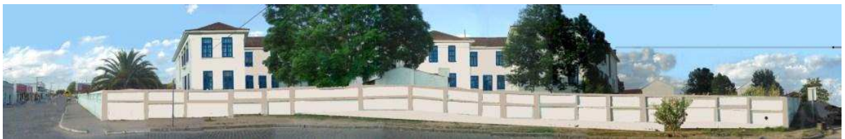
RUA GENERAL CANABARRO_Q18