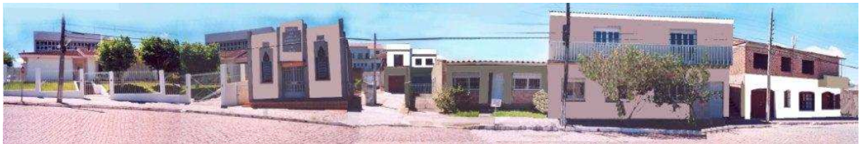
RUA 31 DE MARÇO_Q21