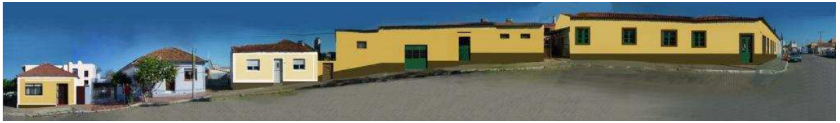
RUA GEN CANABARRO_Q15