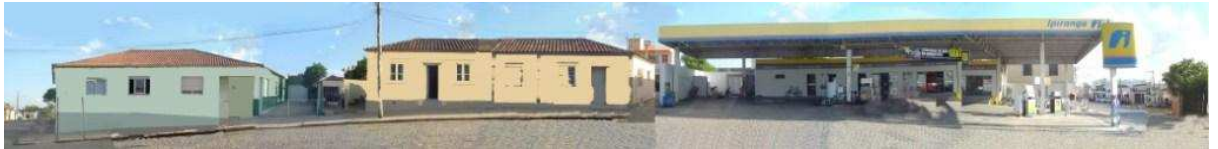
RUA OSWALDO ARANHA_Q19