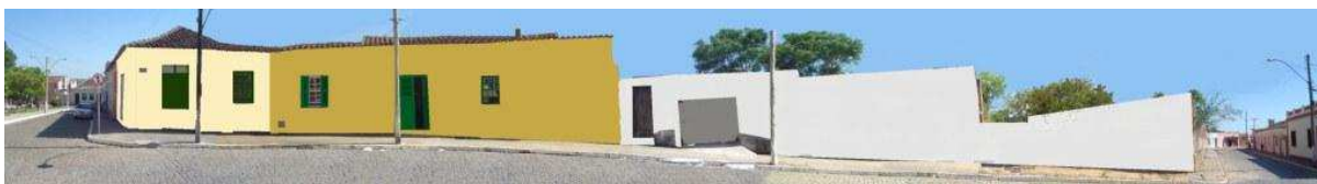
RUA 15 DE NOVEMBRO_Q06