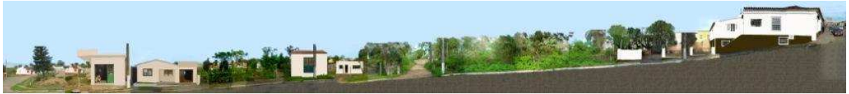
RUA 24 DE MAIO_Q14