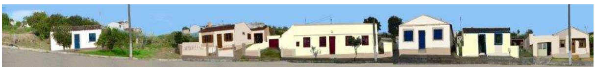
RUA 24 DE MAIO_Q37