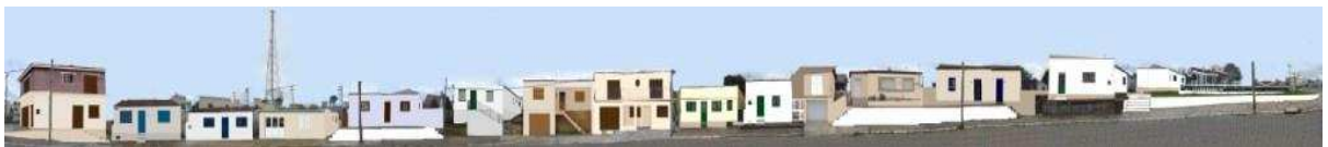
RUA COM FREITAS_Q115