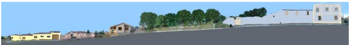
RUA 24 DE MAIO_Q16