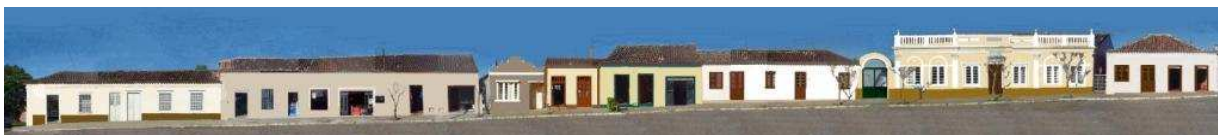
RUA GOMES JARDIM_Q14