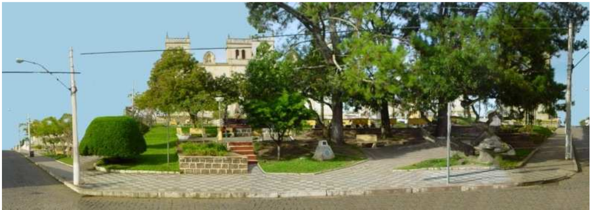
RUA BENTO GONÇALVES_Q01