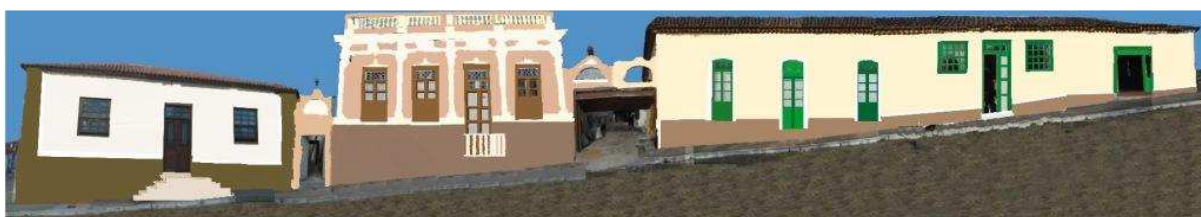
RUA 20 DE SETEMBRO