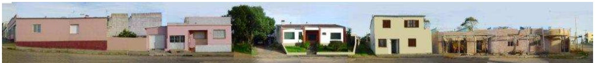
RUA SETE DE SETEMBRO_Q20