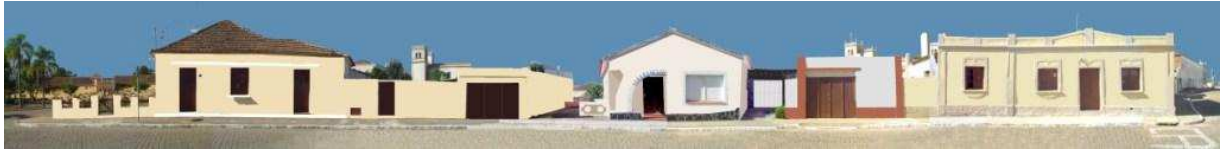
RUA CORONEL MANOEL PEDROSO_Q03