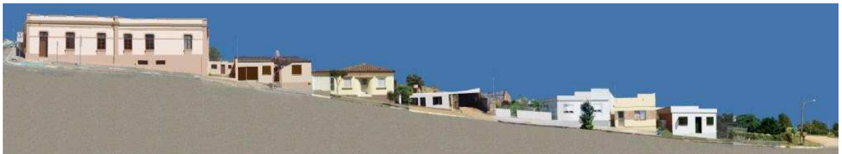
RUA COMENDADOR FREITAS_Q11