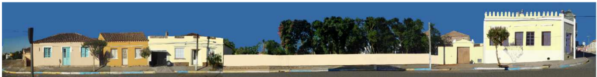
RUA COMENDADOR FREITAS_Q13