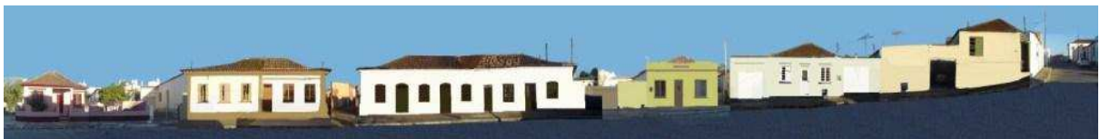
RUA GENERAL DALTRO FILHO_Q8 e Q9