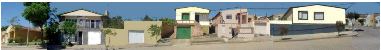
RUA EDMUNDO XAVIER_Q37