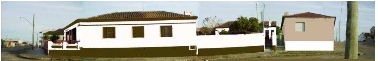
RUA SETE DE SETEMBRO_19