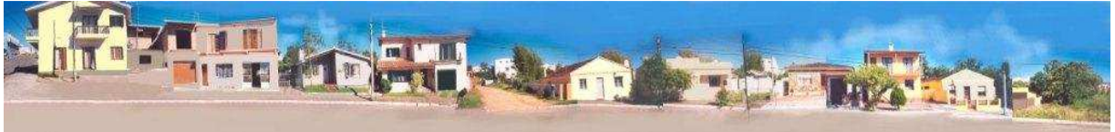
RUA 31 DE MARÇO_Q17