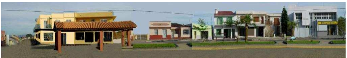
RUA MAURICIO CARDOSO_Q21