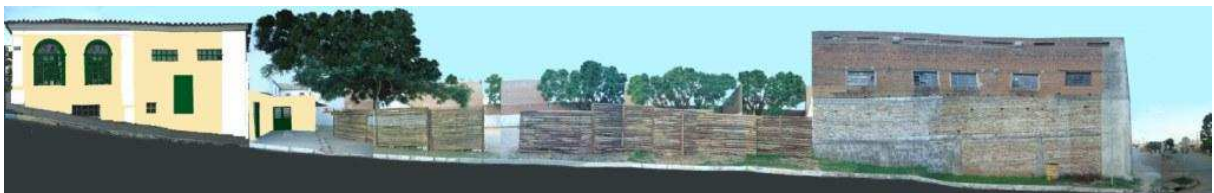
RUA 24 DE MAIO_Q15