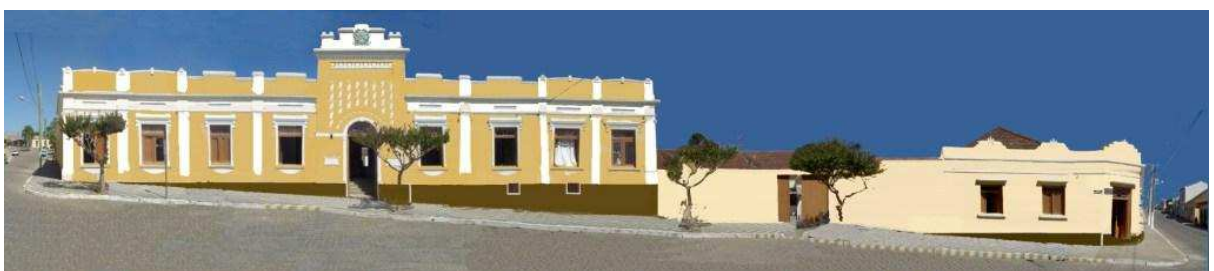
RUA COMENDADOR FREITAS_Q02