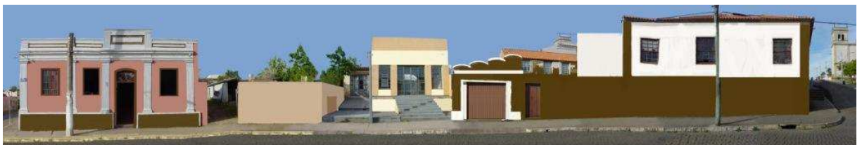
RUA BENTO GONÇALVES_Q08