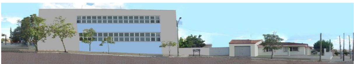
RUA CRISPIM GOMES_Q21